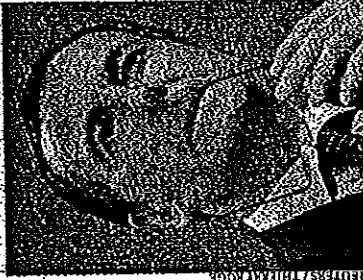
Verantwortlich für Agentur: Justizkommissar Franco Frattini